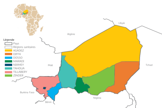
Figure 1: Carte du Niger

Le Niger est limité au nord par l'Algérie et la Libye, à l'Est par le Tchad, au Sud par le Nigeria et le Bénin et à l'Ouest par le Burkina Faso et le Mali. Sur le plan administratif, le Niger compte 8 régions : Agadez, Diffa, Dosso, Maradi, Niamey, Tahoua, Tillabéry, Zinder et Niamey.