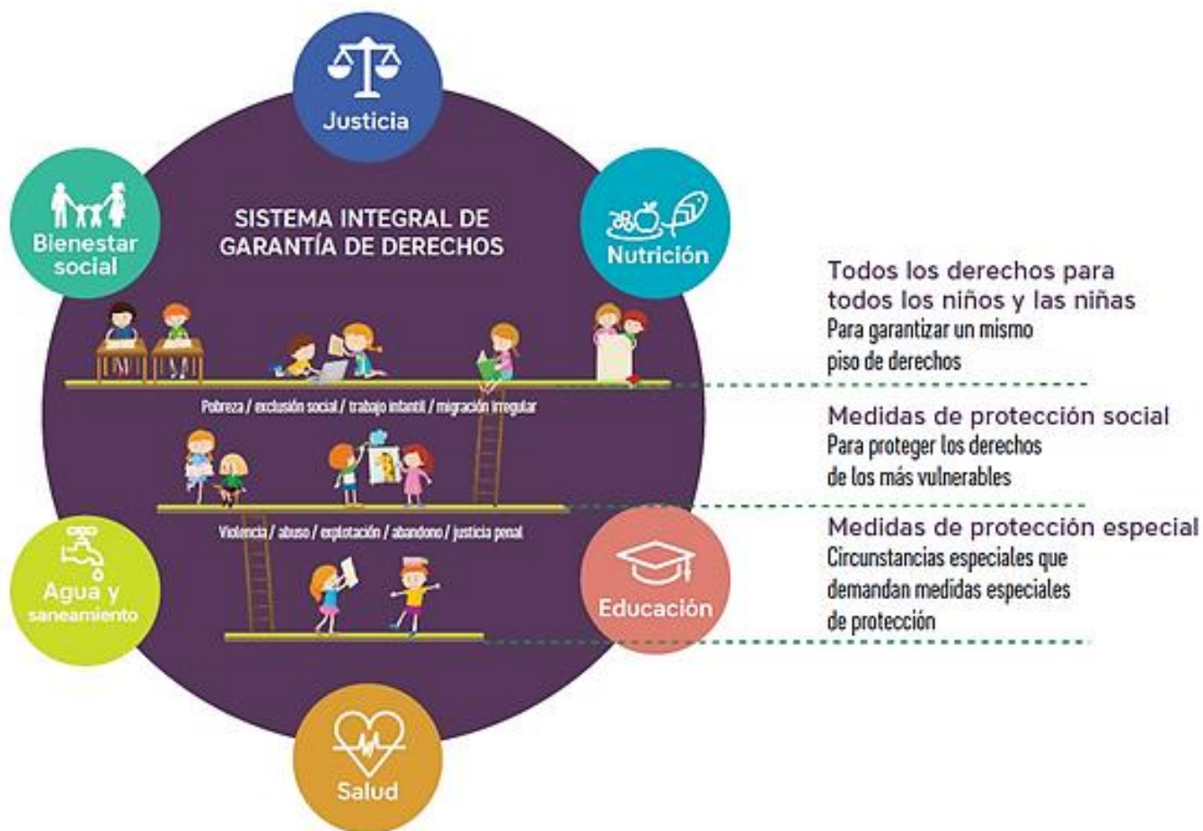
Figura 3: Esquema de los niveles de medidas del SIGADENAH.