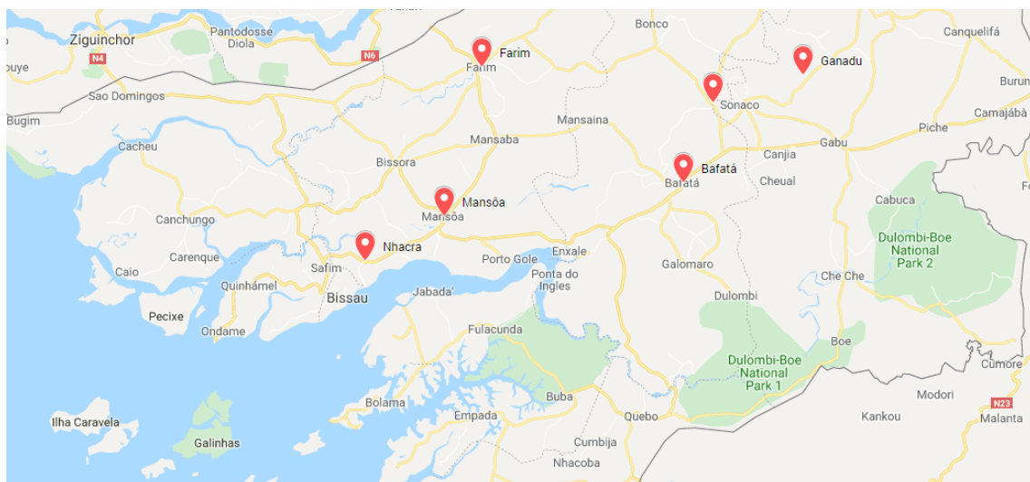
Figura 2- Setores da amostra da avaliação na Guiné-Bissau

A região de Oio apresenta características socioculturais e económicas bastante distintas das outras regiões visadas no projeto, por congregar várias representações étnico-religiosas e, que predominam em vários setores, acabando assim por determinar de forma decisiva os seus estilos de vidas e o seu modo de adesão e participação na vida social e institucional da região. Estas crenças também influenciam muito fortemente sobre o uso de direito à escola e saúde dos seus filhos, sendo que para algumas, as meninas são reservadas para as tarefas domésticas e cuidados do lar e os meninos, têm que pastorear e ocupar-se em atividades produtivas para ajudar a alimentar o lar, e muitas famílias são polígamas.