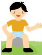
Figura 1. Teoría de Cambio para el componente de Primera Infancia del Programa de País