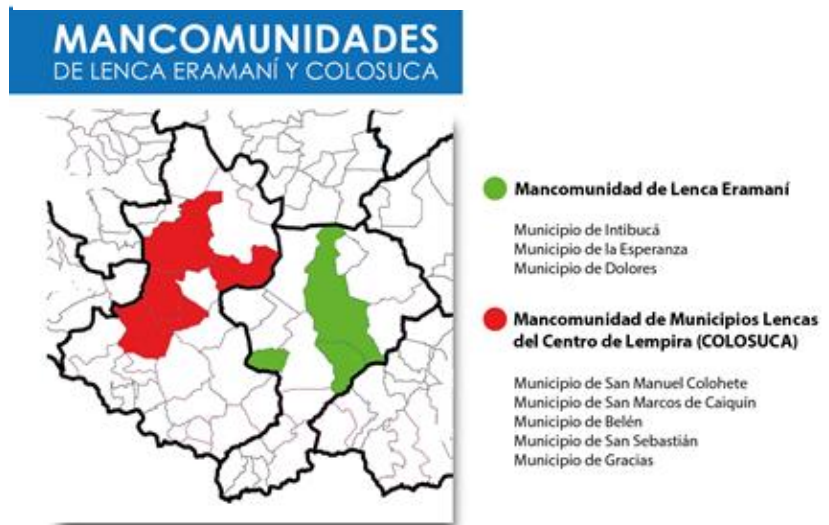
Mapa 2. Municipios que conforman las mancomunidades de Colosuca y Lenca-Eramaní

Para finales de 2018, el Gobierno de Honduras reportó haber extendido, con sus propios recursos financieros y técnicos, la implementación de la Estrategia a otros 123 municipios de los departamentos occidentales de: Copán, La Paz, Ocotepeque, Santa Bárbara y regiones no cubiertas de Intibucá y Lempira.